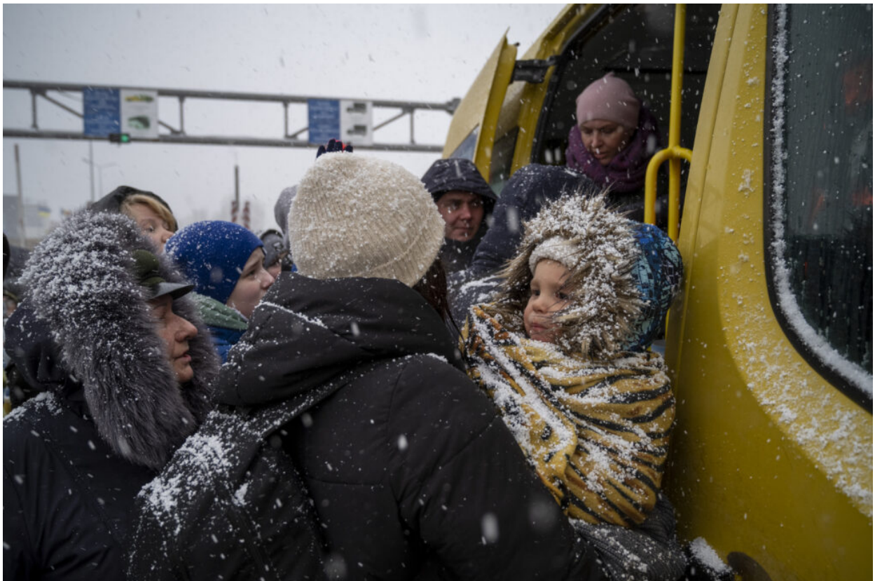
Imagen: Foto de Gonzalo Höhr para Acción contra el Hambre.