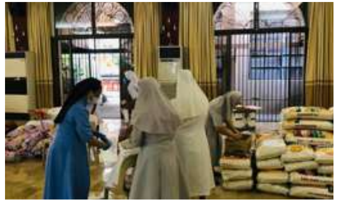
Preparando ayuda para las familias sin recursos afectadas por COVID 19

Este último fondo, en virtud de la ley Bayanihan 2, cubrirá las asignaciones por riesgo especial y la prestación por peligrosidad para los de primera línea. También incluye fondos para el Departamento de Trabajo y Empleo para la implementación de programas de dinero por trabajo.