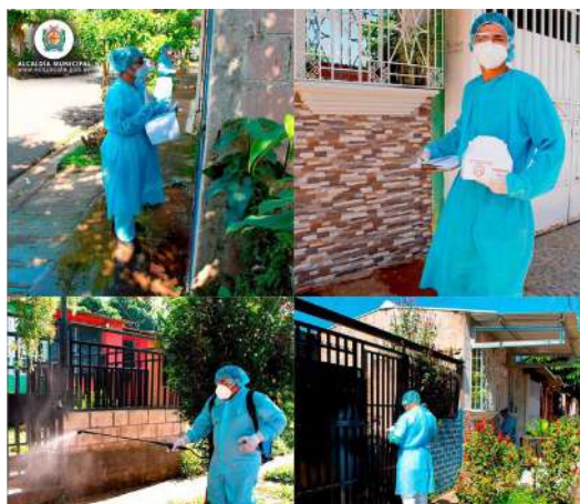
Jornadas casa a casa, Alcaldía Sonzacate

de alimentos y el 100% de enfermos atención médica, medicamentos y traslado de ser necesario. También se inició un rastreo de casos, para tratar de contener al máximo el rebrote. Es evidente que hay un alza en los contagios y un riesgo alto de que exista una segunda ola epidemiológica, si bien los datos oficiales muestran dos últimos picos en la curva, combinando más casos con más pruebas, no siendo demasiado claros.