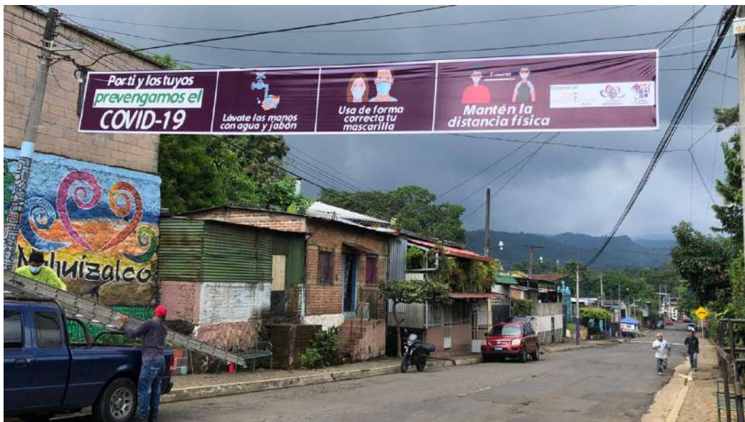
Campaña prevención COVID (FUMA-Alcaldia Nahuizalco)

En todo caso testimonios de mujeres victimas de violencia, señalan la no atención a sus casos en instituciones como ISDEMU, algo preocupante para las mujeres y las encargadas de las Unidades Municipales de la Mujeres, ya que son el ente rector y muchas veces prefieren hacer las coordinaciones directamente con otros actores en la búsqueda de solución a los casos que ellas reportan.