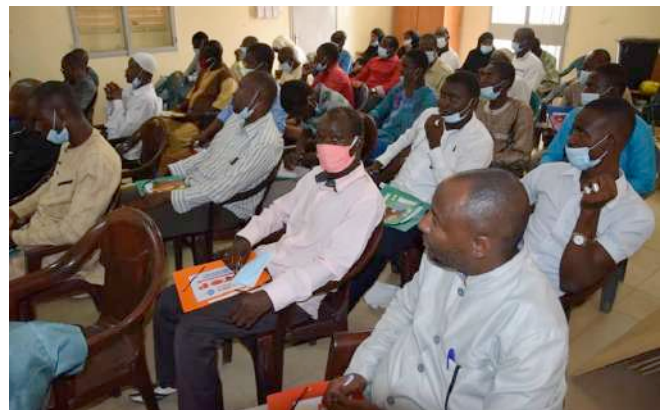
Profesorado de institutos de Say, Níger - formación sobre medidas anti-COVID.

Los estudiantes de Níger regresaron a la escuela el lunes 1 de junio 2020 por un período de 45 días. El curso escolar finaliza el 15 julio 2020. Los exámenes de fin de año (BEPC – educación primaria, y BAC – educación secundaria) serán realizados en agosto.