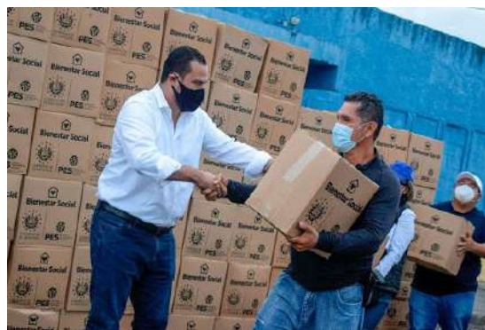
Entrega de alimentos gobierno central

El 15 de octubre el presidente anunció apoyo económico para empresas afectadas por la pandemia "En la primera etapa se desembolsarán $140 millones para el pago de planilla para dos meses; el único requisito es que tenga menos de 99 empleados y que facturen menos de $7 millones al año", con el fin de apoyar a empresas que se han visto afectadas durante los meses de la pandemia y aplicará desde diciembre de 2019 a la fecha.