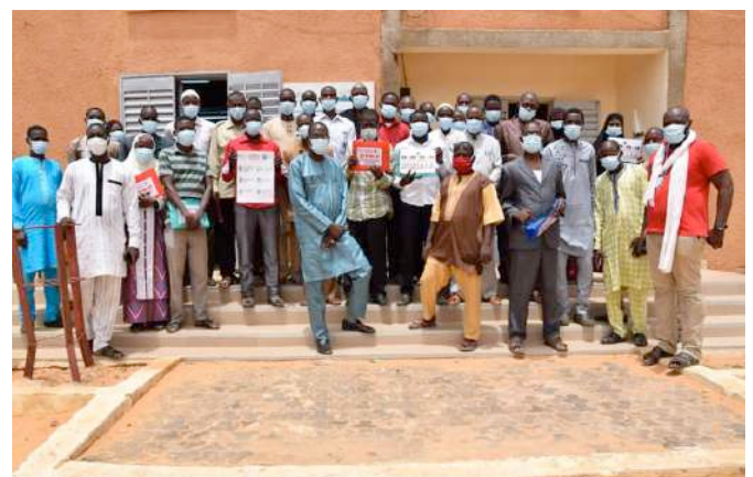
Formación profesores en Say, Níger