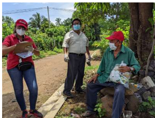
Entrega de alimentos alcaldía de Sonzacate

Las medidas económicas de entregar alimentos a las familias salvadoreñas se ha mantenido y las familias se encuentran en la cuarta fase de entrega de alimentos. Algunas municipalidades también están haciendo entregas de alimentos y muchas ONGD están desarrollando campañas de sensibilización y educación con las medidas para prevención del contagio por COVID-19.