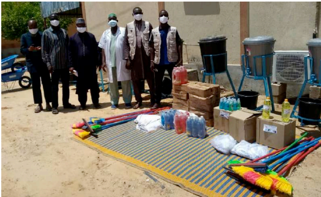
Entrega de materiales y equipos de higiene en un centro de Madre e Hijos en Diffa, Níger