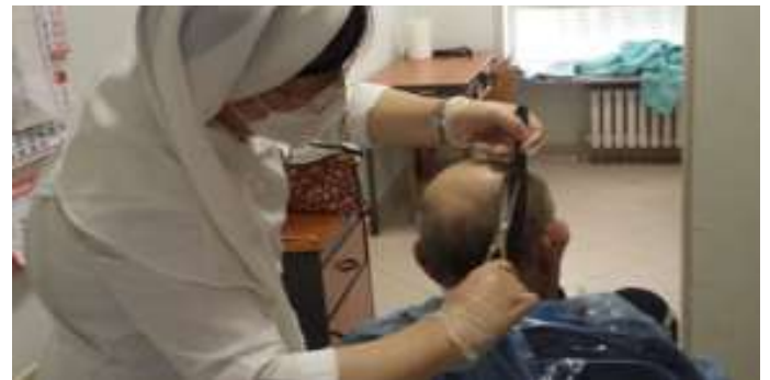
Atendiendo a personas necesitadas

No se permitirá la entrada a todas las oficinas, transportes públicos y diversos establecimientos como centros comerciales y tiendas departamentales a las personas que no tengan mascarillas ni protectores faciales.