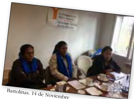
Bartolinas. 14 de Noviembre