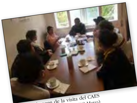
Una imagen de la visita del CAES Piura (18 Mayo)