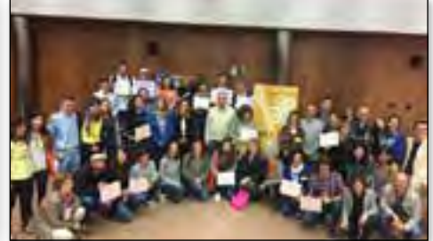
IX Encuentro Escuelas Solidarias