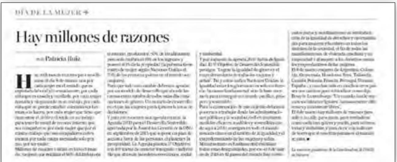
Artículo de opinión 8 de marzo