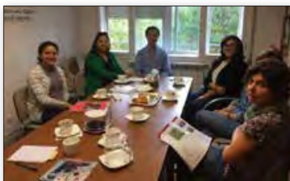
Kenia. 26 de Septiembre

Desde la Coordinadora agradecemos enormemente estas visitas porque nos ponen en contacto con el día a día de nuestro trabajo.