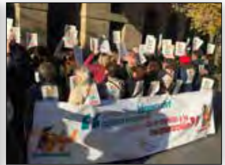
Campaña "Les Dan la Espalda"