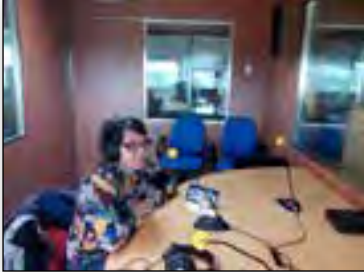
Entrevista SER. Encuentro Educación

La cobertura por parte de los medios ha vuelto a resultar muy alta.