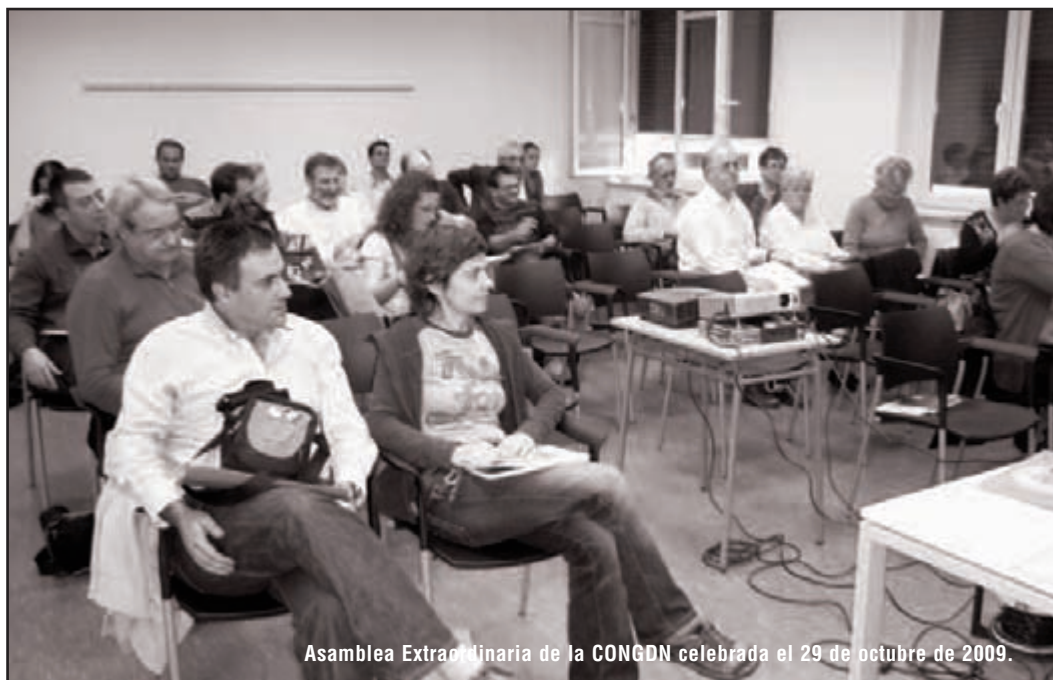
Asamblea Extraordinaria de la CONGDN celebrada el 29 de octubre de 2009.

El 29 de octubre de 2009 se realizó una Asamblea Extraordinaria donde se aprobó priorizar, en el amplio abanico de trabajos que sostiene la CONGDN, ciertas labores, no sólo con el objetivo de trabajarlas con relevancia y mayor ahínco sino con la intención de transformarlas en el hilo conductor para todas las comisiones, como camino por el que avanzar, sin dispersarnos, desde las mismas líneas de acción: con una mayor incidencia social y política, con la participación y el fortalecimiento de redes, de las ONGD miembros y de la propia Coordinadora. Esta labor ya la venimos recogiendo con las reuniones con los partidos políticos donde se están haciendo aportaciones para la modificación de la Ley Foral 5/2001 de Cooperación al Desarrollo de Navarra, con las reuniones con los