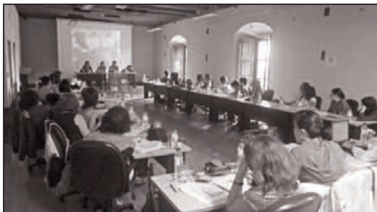
Seminario de Intercambio y Formación en Buenas Prácticas en Educación para el Desarrollo, Septiembre 2009 Antigua, Guatemala.

En el caso del centro Arturo Kanpion, este se presentó al certamen con el proyecto educativo “Mi clase, un mundo” siendo este un proyecto de colaboración entre escuelas, con escuelas etíopes con las que los/as niños/as navarros tuvieron la posibilidad de intercambiar dibujos y fotos, así como de trabajar temas como la adopción o el apadrinamiento entre otros. Para ello contó con la colaboración de la ONGD “Asamblea de Cooperación por la Paz”.